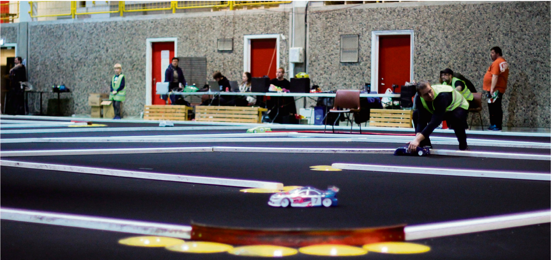
RUNDE ETTER RUNDE: Andre runde i norgescupen innen radiostyrt motorsport ble arrangert i Ringerikshallen i helgen.

72 RC-deltakere testet sine ferdigheter på landets største bane